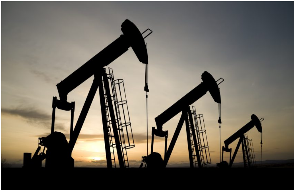
Pompas a petróli

de plateus que tremolan ; en fach mandan d'ondas que se propajan dins lo jos-sól e que se refleiton sus d'unas zonas geologiquas. De mai, sus de miliers de kilometres a la ronda dispausen de miliers captors, los sonam « geophones ». Eles van reçaupre las ondas, e per rapórt al temps que aquel echó monta a la susficia pódem saupre quinas sisas nos intereisson, mas aquó nos permet pas de saupre ont i a de petróli permet de saupre ont i a benleu un terrenh favorable. Quand avem las resultas dels estudis ressembla pas a grand causa, lo retranscrivèm sus un ordenador amb d'images en 3D. Quand pensam que i a un gisement fasèm venir un aparelh de forage. Lo forage es un trabalh dur, mantunas equipas se relevan 24 oras sus 24 per atenher lo gisement, se un se trapa a 4000 m de prigondor seguon la duresat de las rócas, prendra 2 o 3 meses. A fur e a mesura botam de tigas per anar trapar de petróli.