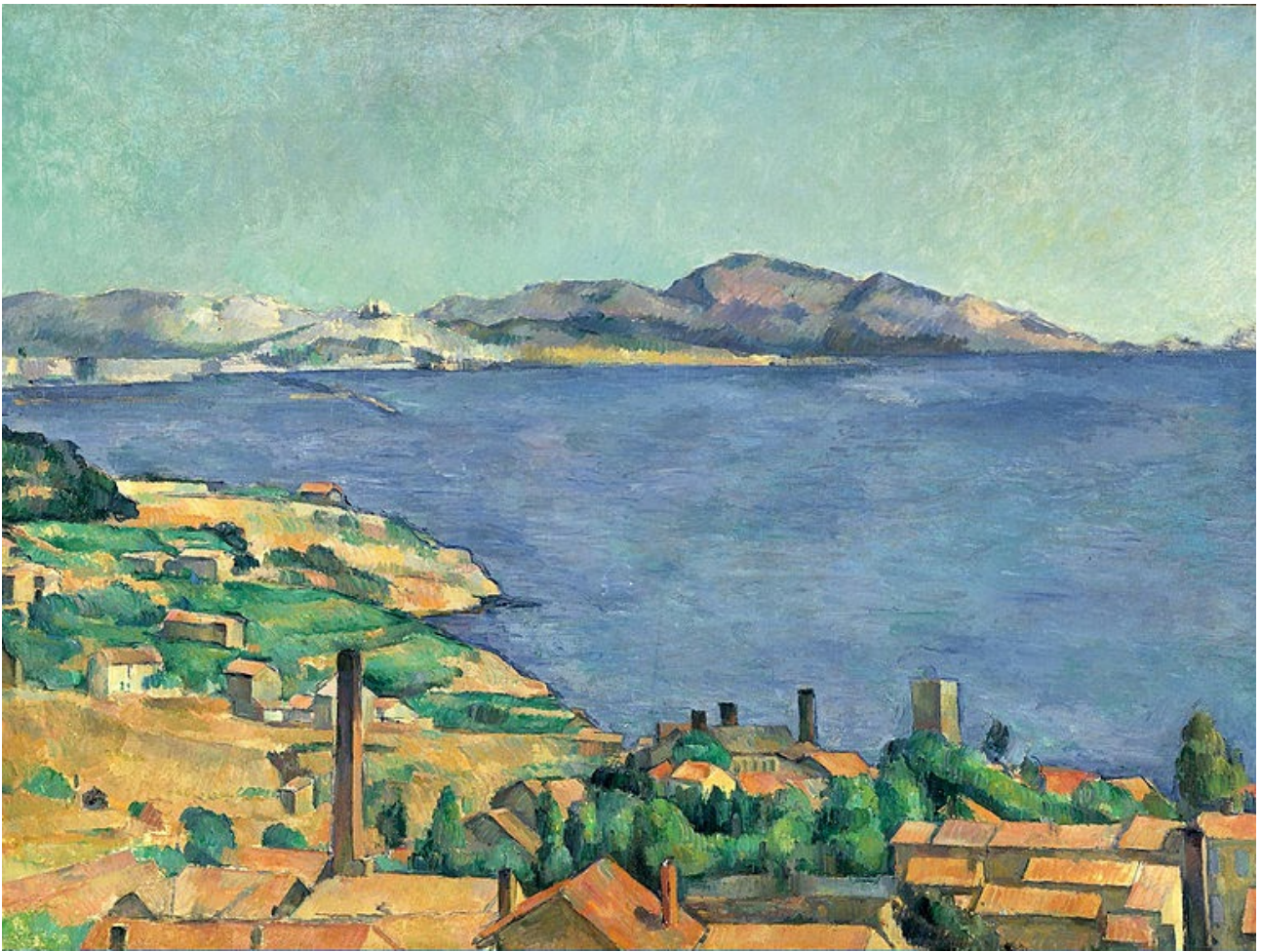
Le Golfe de Marseille vue de l'Estaque, 1885, Paul CEZANNE