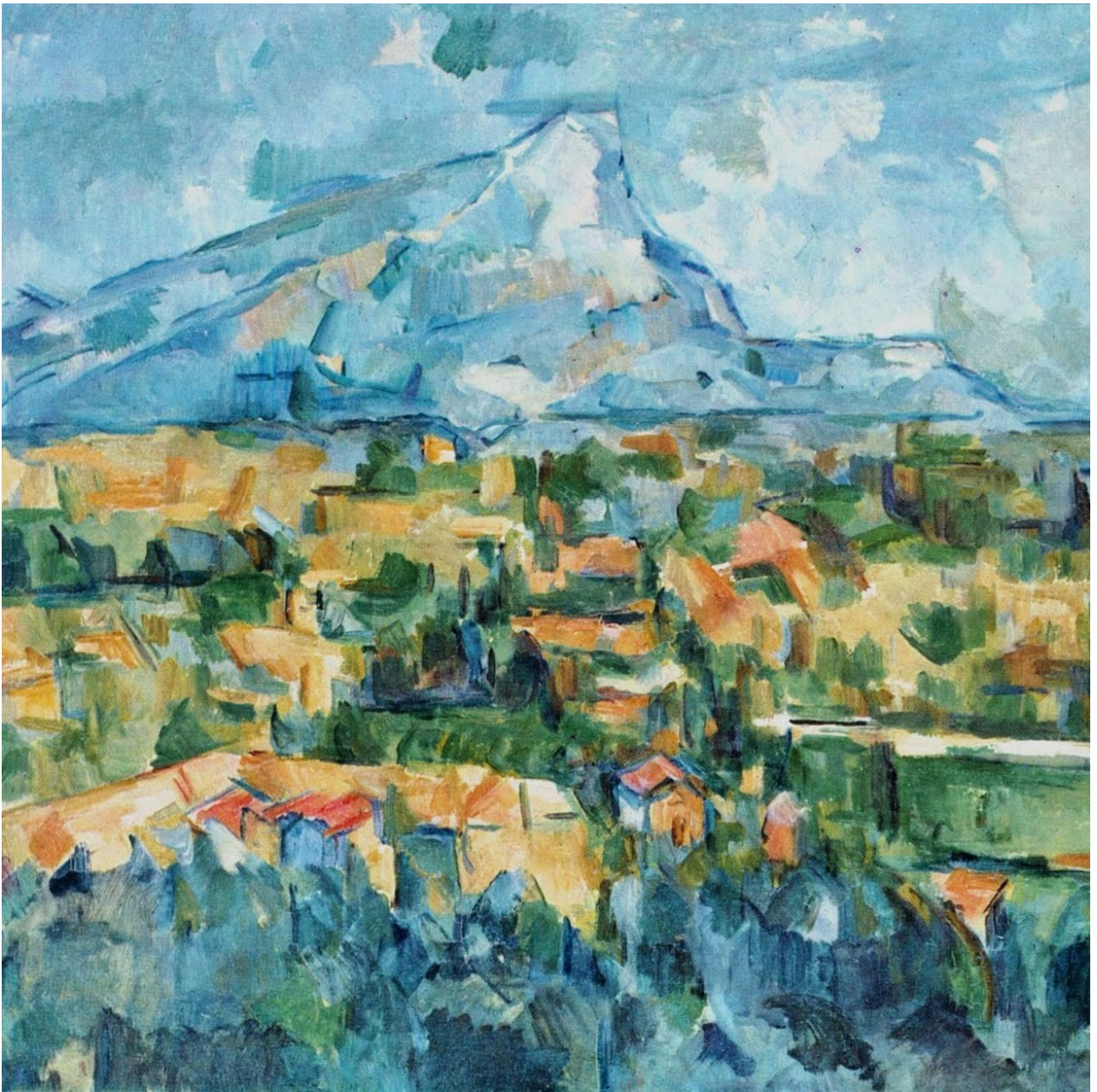
Mont Sainte-Victoire , 1885, Paul CEZANNE