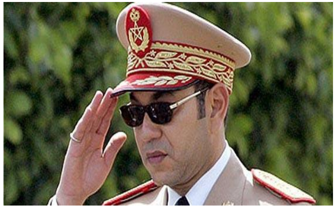
El Rei del Marroc Mohamed VI.

Les poblacions principals són Smara, Bir Lehlu, La Güera i Guerguerat. El territori del Sàhara Occidental a tres regions marroquines: el Oued Ed-Dahad-Lagouira, Laâyoune-Boudjour-Sakia El Hamra i Guelmin-Es Semara.