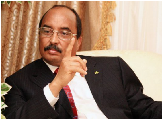
El president del Front Polisari Mohamed Abdelaziz.

Una part del Sàhara Occidental està sota el control del Marroc, però el Front Polisario, que va constituir el 1976 la República Àrab Sahrauí Democràtica, el disputa. Hi ha hagut unes quantes guerres entre els dos fronts. La República Àrab Sahrauí Democràtica és una república i el regne de Marroc és una monarquia, doncs el Sàhara Occidental és més una monarquia que una república. És diu que el RASD (o Front Polisari) té una petita part del Sahara Occidental, però és el contrari. El Sàhara Occidental va ser en una guerra i va guanyar el Marroc.